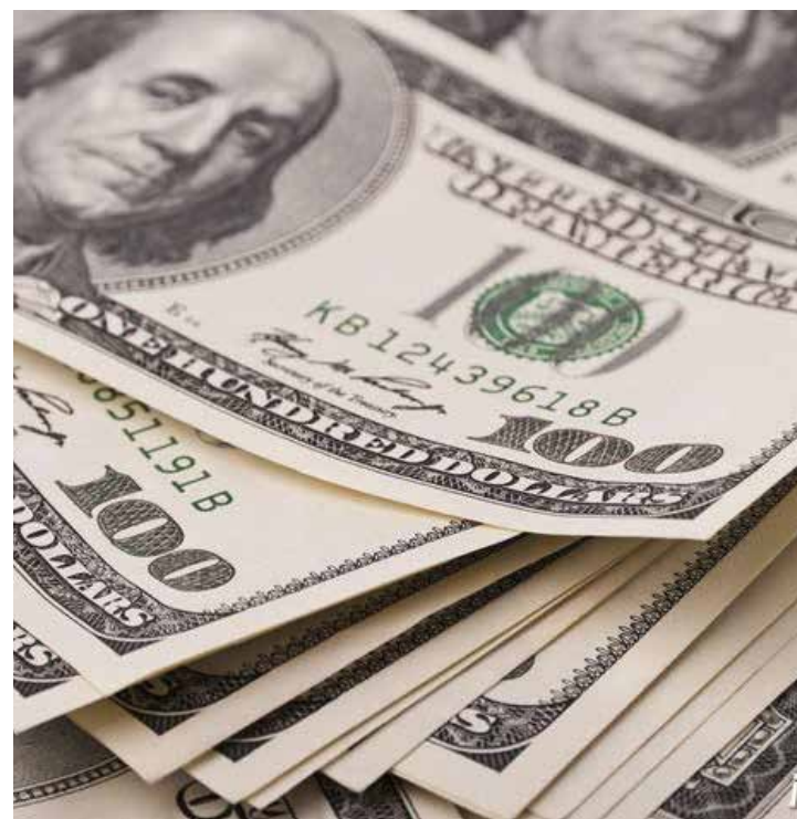
Prometieron dolarizar el salario y ahora no quieren el aumento de sueldo.

cuando se aumenta el salario es el primero en aseverar que eso no sirve. La demagogia se paga a tasa Dolar Today, dígalos ahí Guanipa.