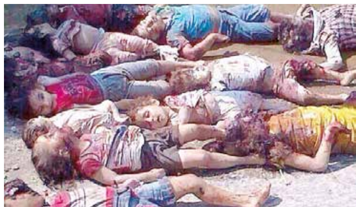
Apuntan a los niños.

carnicero Netanyahu, produce de esta forma un nueva vuelta de tuerca que haría empalidecer al propio Herodes. Apuntan a quienes más temen: la niñez palestina, esos chicos y chicas que por la imposición de la ocupación han reemplazado los juegos y diversiones que son habituales en sus coleguitas del mundo y corren por las calles esgrimiendo el arma más temida: con sus pequeños dedos hacen la V de la victoria. •