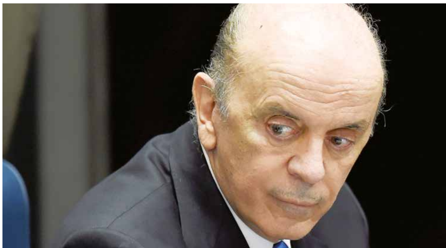
Brasil juega a la diplomacia oscura.

Propio de la politiquería de oficio, fatua, vacía, poco proba en los asuntos de la conducción del Estado, lo que se pone en evidencia es la escasa capacidad que demuestran estos pseudo líderes para hacer una verdadera política exterior que integre al continente latinoamericano en función de los intereses nacionales y regionales ahora tremendamente cuestionados en el seno del Mercosur por las calenturientas acciones de la triple alianza. No se trata ni debe tratarse de cuál gobierno o líder regional se “quede” con el martillo del Mercosur, se busca fortalecer al bloque como instrumento de política exterior a escala regional. Instrumento geopolítico de excepcionales cualidades frente a eventuales negociaciones comerciales con otros bloque de poder a nivel global. Debilitar al Mercosur significa debilitarse a sí mismos. Eso lo saben perfectamente bien los recién instaurados gobiernos reaccionarios que forman parte del esquema de integración, solo que prefieren dinamitar al esquema, antes que compartirlo democráticamente con países de tendencias ideológicas disímiles, en sustancia, la típica actitud histórica de la derecha reaccionaria nuevamente de manifiesto.