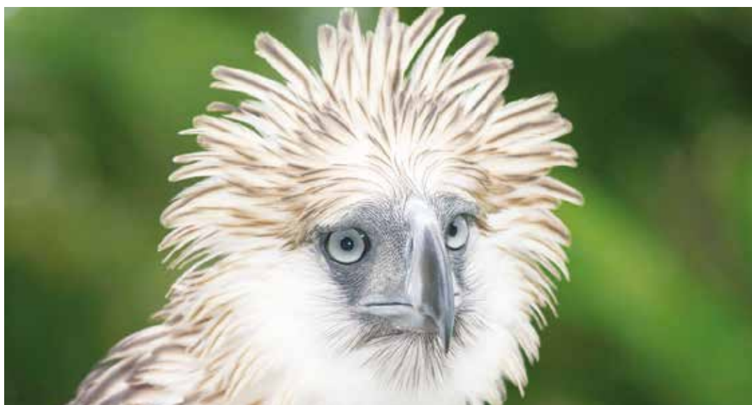
Se estima que la mitad de las especies del planeta se habrán extinguido a final de este siglo.

Las grabaciones se han llevado a cabo en tres áreas representativas de bosque tropical primario, en el Amazonas, África y Borneo. La razón por la que se han elegido estos bosques es por que el bioma de los bosques ecuatoriales integra los ecosistemas más complejos de la Tierra.