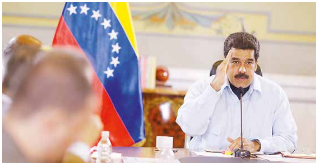
Presidente Maduro: Es el mismo formato de golpe.

El mandatario venezolano destacó que quienes promueven el golpismo en Brasil reconocen la importancia del gigante suramericano para América Latina y el Caribe, ya que ha sido crucial la participación de los gobiernos