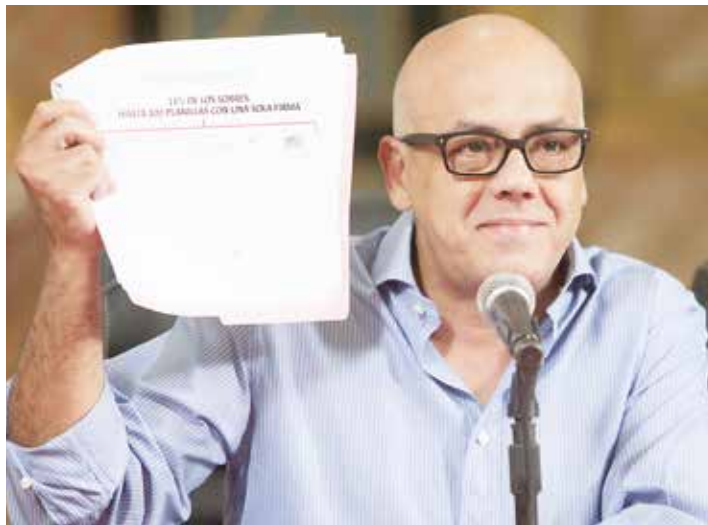
Jorge Rodríguez: Si vulneran la ley se activará un juicio penal.

Como si las mentiras no fueran suficientes, la derecha se apoya con el fraude de identi-