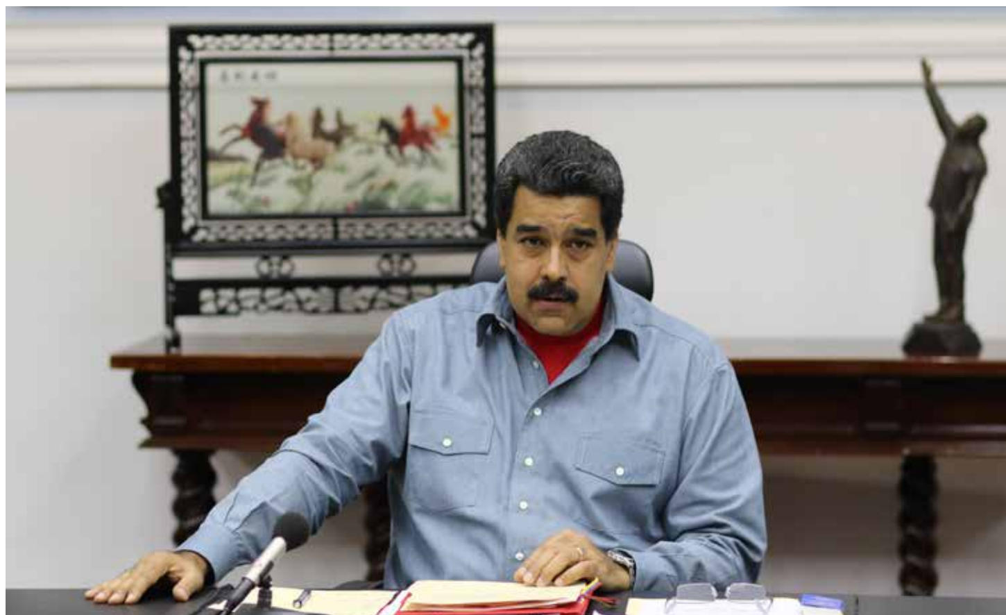
Maduro: triunfaremos frente a la guerra económica.