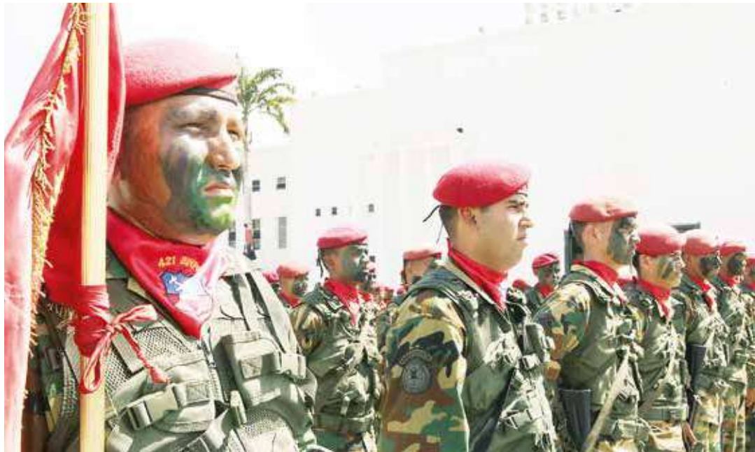
No han respetado ni a los familiares de los efectivos.