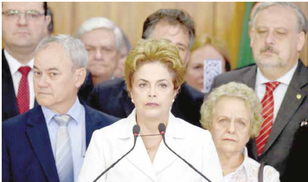
Dilma ha sido víctima de la nueva fórmula destituyente.