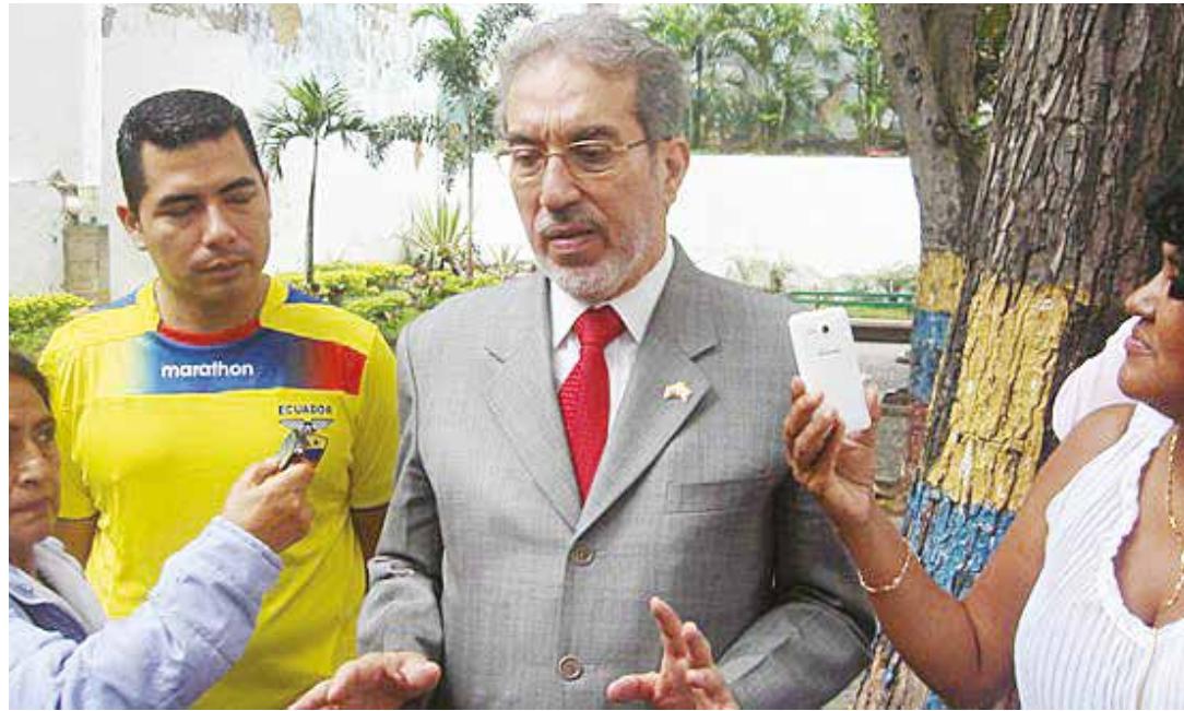
El Alba permitió fortalecer la solidaridad.